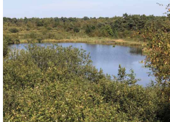
Landschap De Liereman